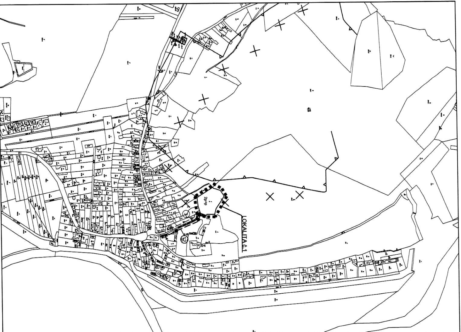
SCHÉMA VEREJNOPROSPESŇNÝCH STAVIEB A PLOCH NA ASANACIU